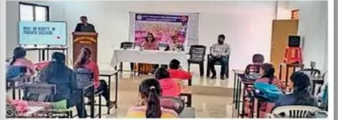
धमतरी। औषधीय पौधों की जानकारी देते प्रोफेसर।